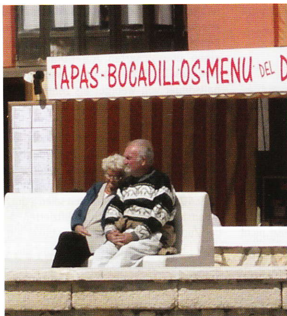
Rentner unter Spaniens Sonne

Als im Jahr 2004 viele osteuropäische Länder in die Europäische Union aufge-